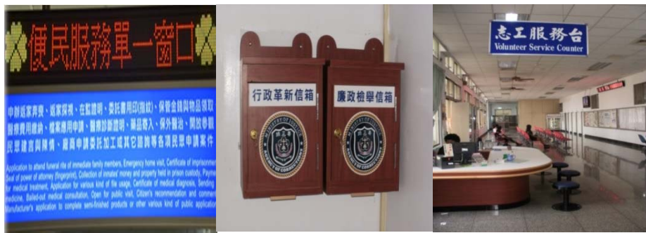
便民服務單一窗口

矯正機關為提升行政效率及服務效能，並落實 E 化政府，101 年起實施「矯正機關便民服務單一窗口」，整合申辦返家奔喪、返家探視、在監證明等多項民眾申請案件。各機關亦擇定處所設置單一窗口全功能服務櫃台，並且清楚標示服務項目，指定專人服務、統一收件，提供予民眾最即時的服务。各機關並設有民眾休息區、育嬰室等便民專區，同時建置無障礙設施及提供民眾洽公停車位等多項便民設備。衷心期盼，矯正機關如此用心的便民服務，能讓家屬安心、放心，而收容人感心、決心，從心出發，進而脫胎換骨、改悔向善，俾早日重返社會，回歸正常生活。